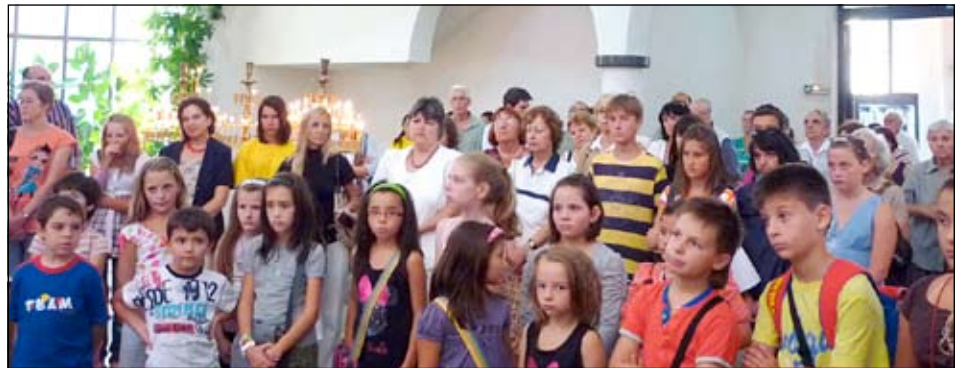
Откриване на новата учебна година с молебен.