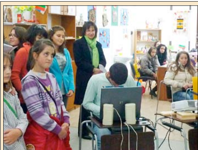
Поредна проява на “Чисти сърца” в Неделното училище - среща с децата от Сърбия за доброволчеството.

Когато занималнята свърши, бяхме заведени към физкултурния салон. Там си има всичко - мрежи, дюшеци, топки и дори столове за публика, ако се разиграва