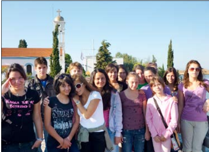
Едно от многото пътувания на клуб "Деца - журналисти"

знам, че в живота винаги има редуващи се възход и падение, ми се иска да запазя радостта за по-дълго. Това става, като се обградиш с хубави и приятни хора.