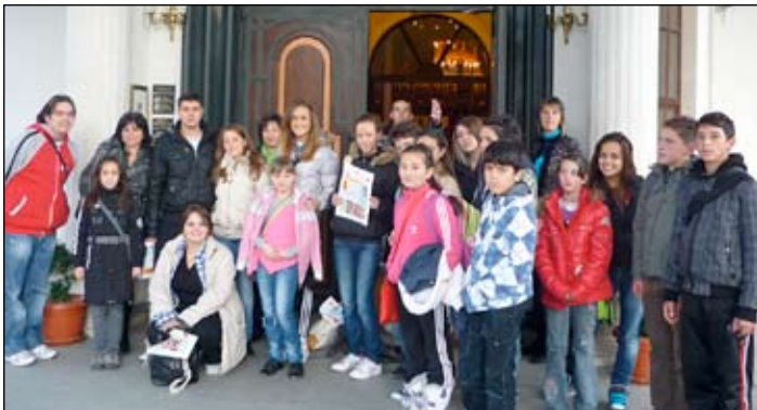
Пред храм „Св. Висарион Смоленски”

„Св. св. Кирил и Методий”, е гимназията „Бора Станкович” в гр. Ниш, Сърбия. Група ученици и учители от тази гимназия ни посетиха от 1 до 5 ноември в Смолян.