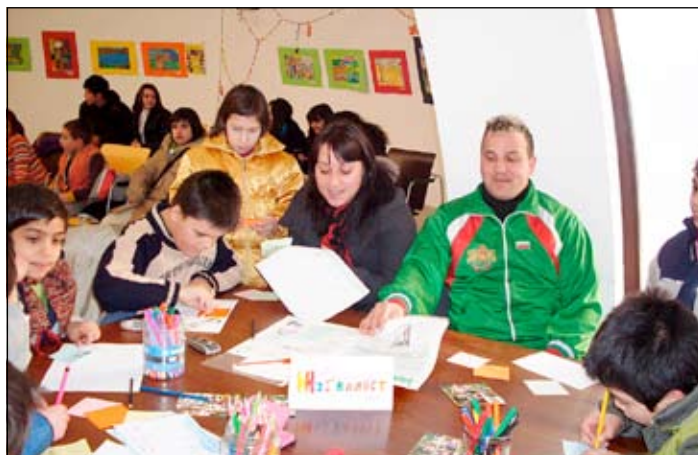
Децата от Широка лъка по време на занимание с приятелите от “Чисти сърца”

има в кутията с медени питки. Първата ни спирка беше при директорката, която от своя страна пък знаеше много любопитни факти за училището си. Разказа ни, че училището е било навремето килийно.