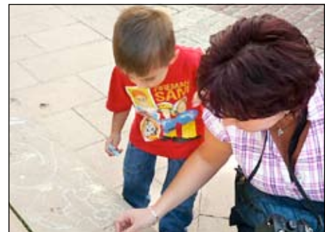
На празника “Да пазим децата на пътя с Вяра, Надежда, Любов!”, 17 септември 2011 г.