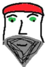
Софроний Врачански (Стойко Владиславов)