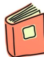
“Житие и страдание грешнаго Софрония”